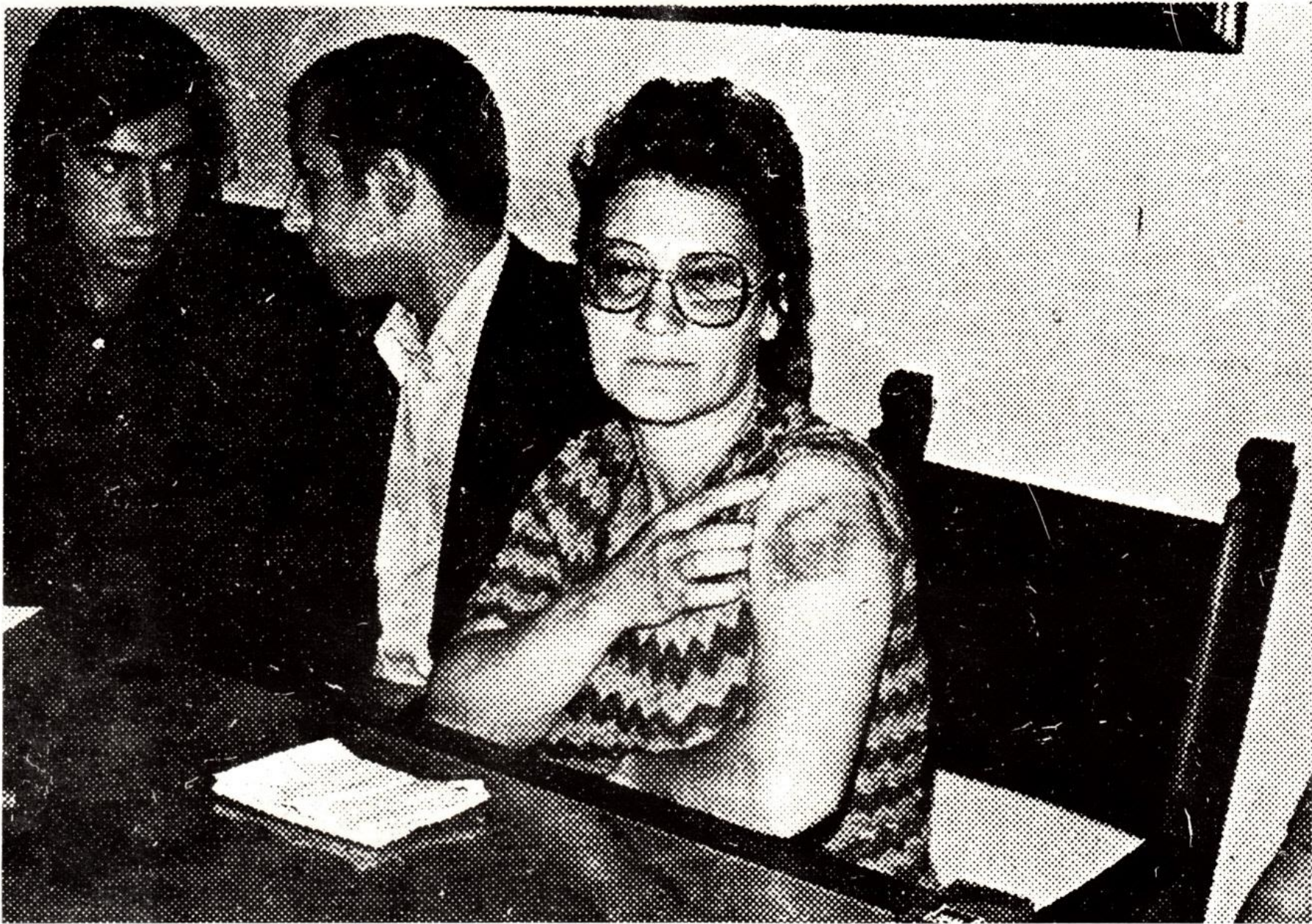
Outra vítima da repressão.