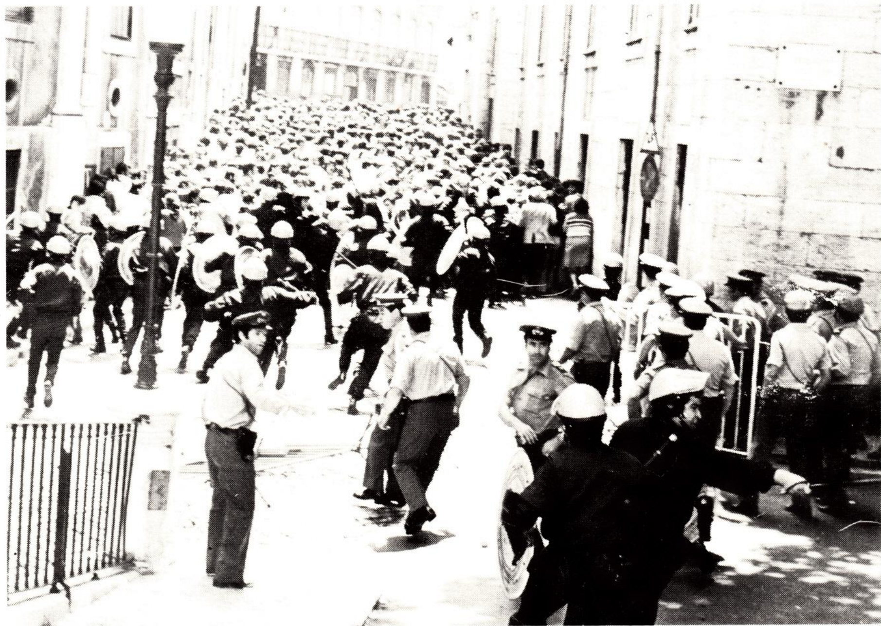
Como se vê nesta e na anterior fotografia, a polícia agride com os bastões ao contrário.