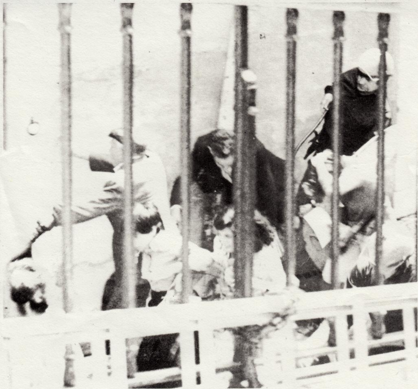
Velhos e crianças ninguém escapa.