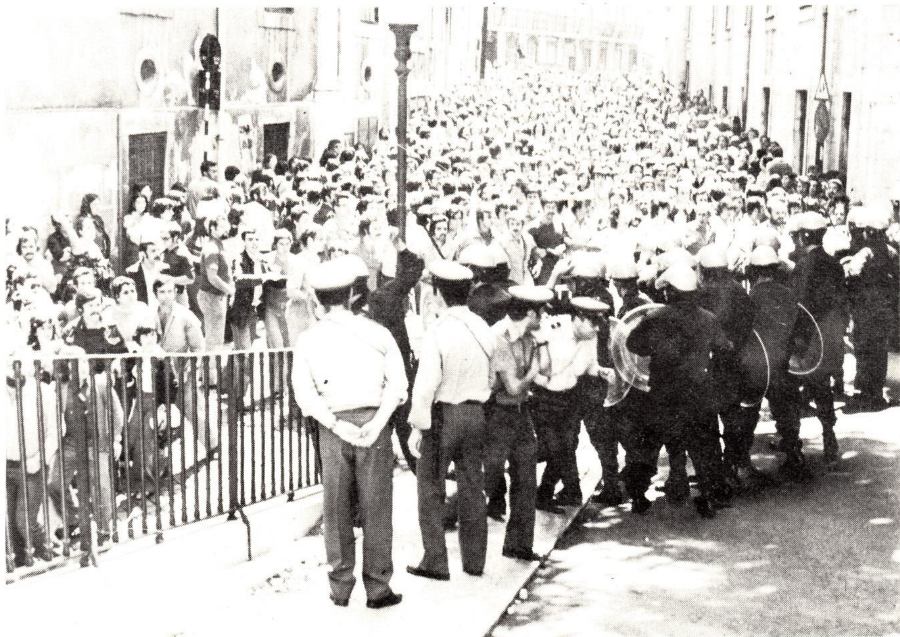
Choques e PSP preparam-se para agredir o povo que queria assistir ao julgamento.