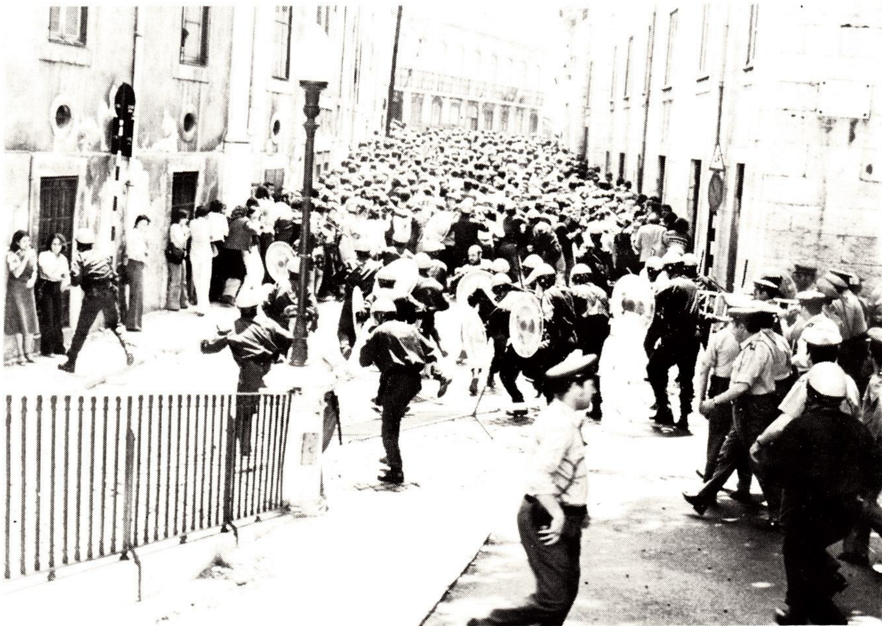
Derrubadas as grades, a carga brutal da polícia.