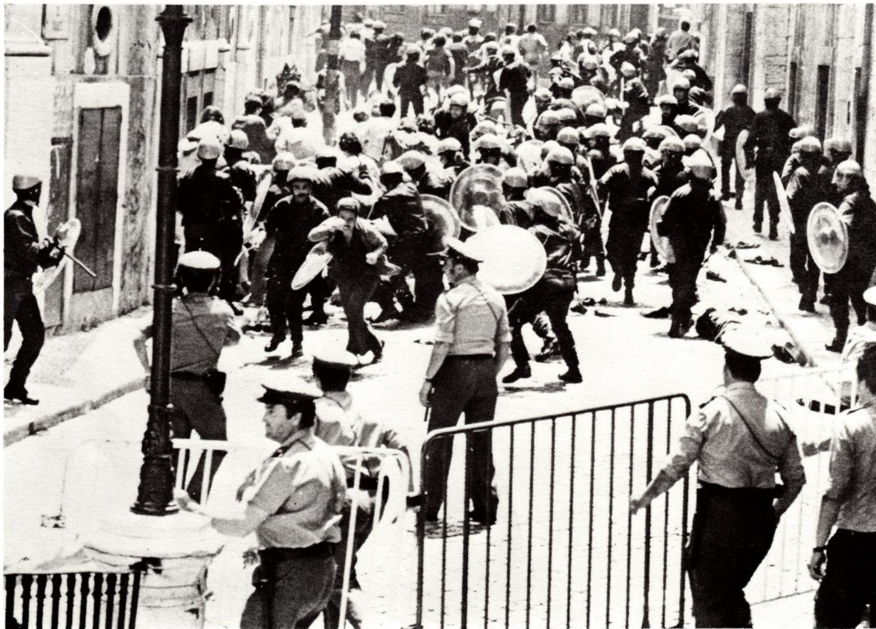
...Agridem selvaticamente um grupo de pessoas caídas no chão.