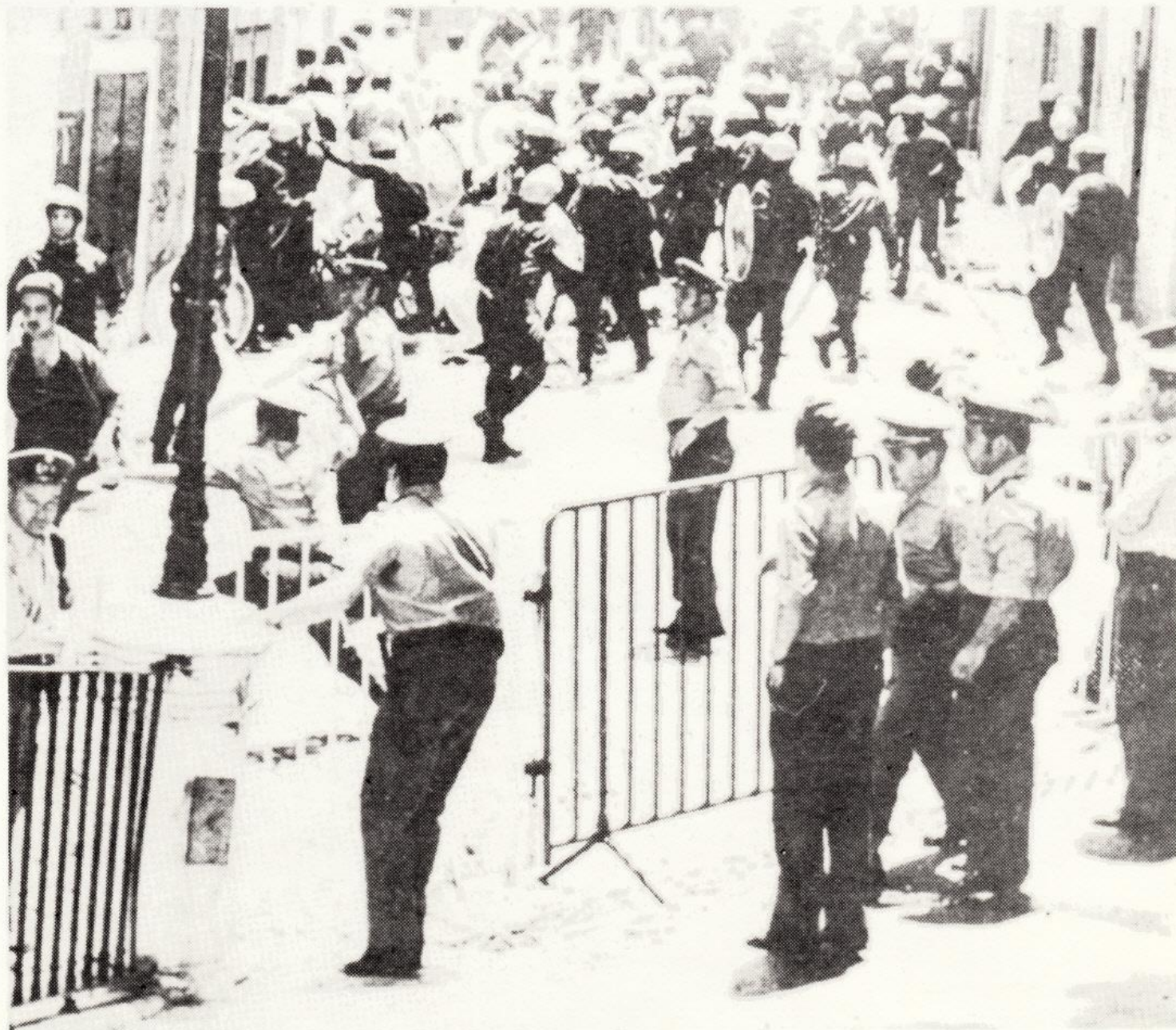
A polícia de (in)segurança pública também ajuda.