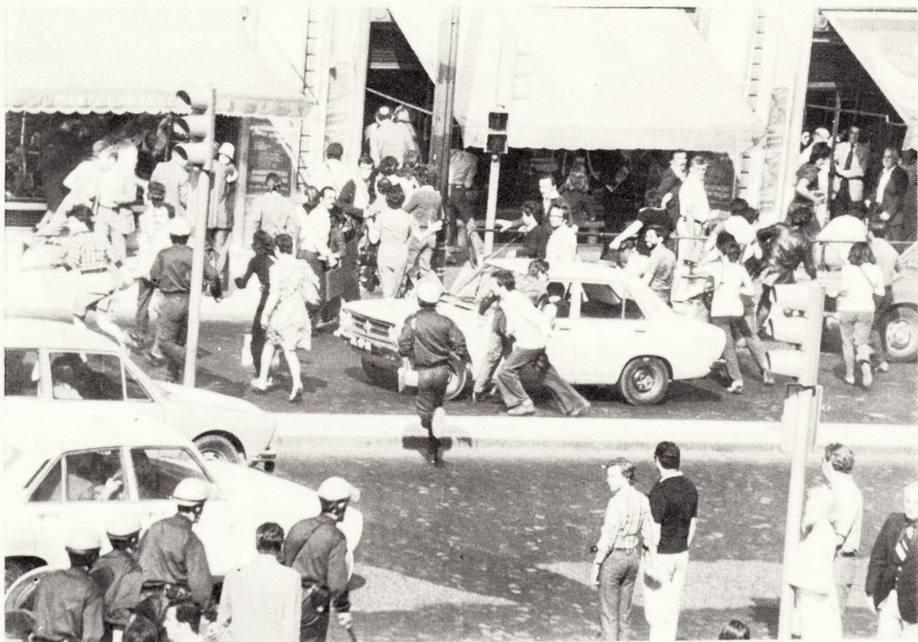
Às 6 da tarde, no Rossio, a polícia continuava ainda a sua "acção".