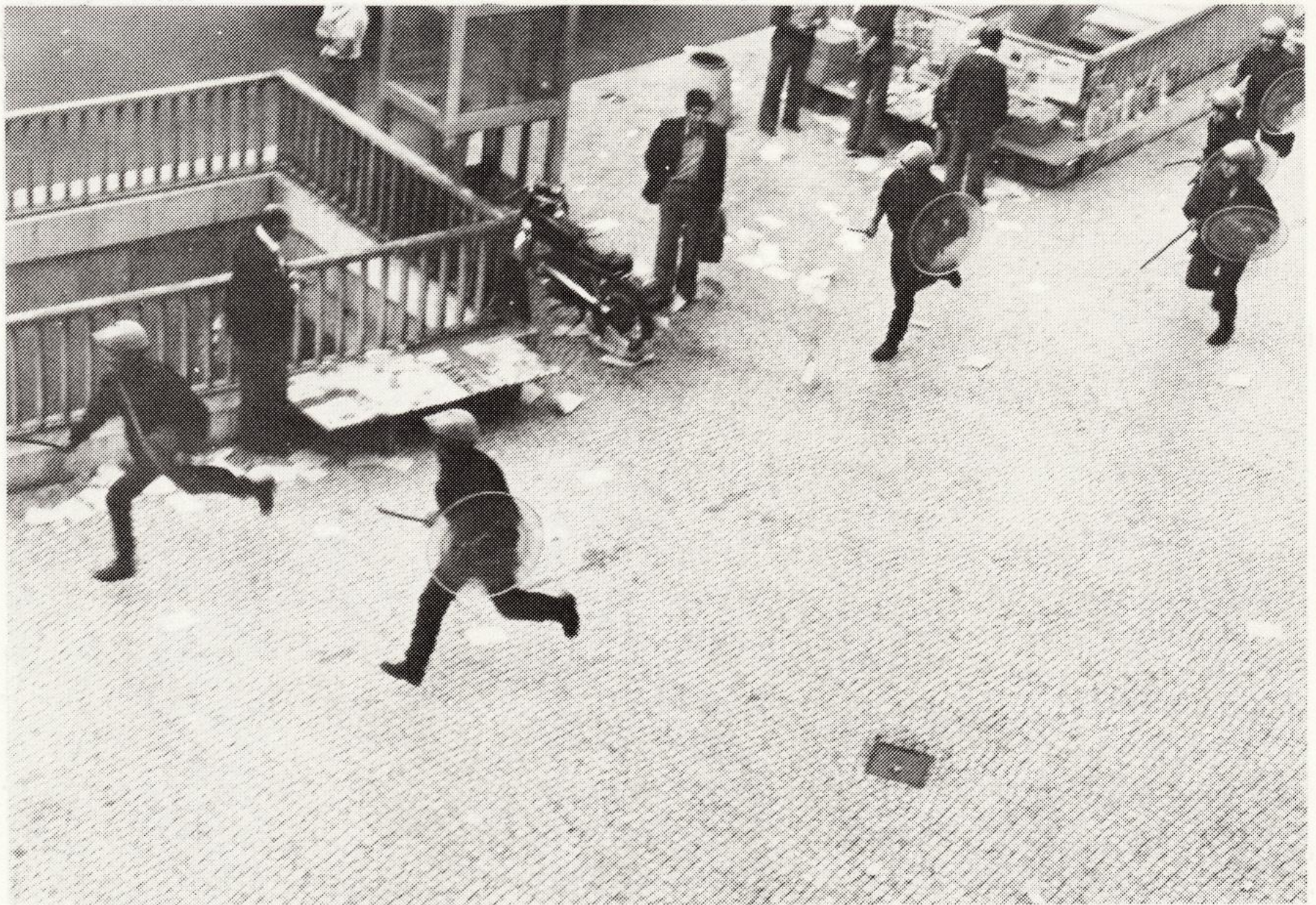
Garantir a "democracia".