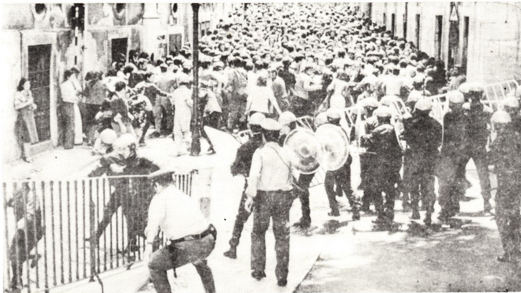
Segundo a PSP "os manifestantes teriam derrubado as grades". A fotografia prova quem foi.