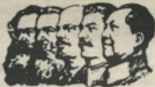
Grandes defensores do Povo trabalhador

Marx, Engels, Lenine, Estaline e Mao Tsé-tung