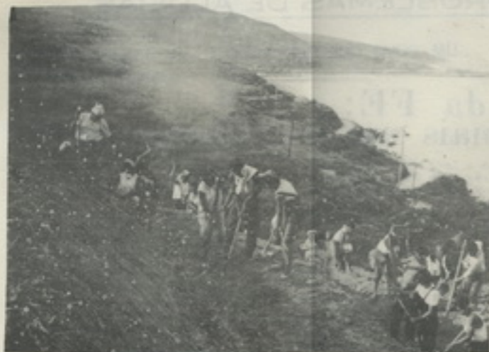
O trabalho colectivo no desbravar das montanhas