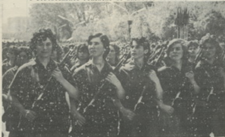
O Destacamento Feminino do Exército Vermelho

EM COORDENAÇÃO COM O JORNAL MIRANDUM A ASSOCIAÇÃO DE AMIZADE PORTUGAL ALBANIA PRO MOVE EM MIRANDA DO DOURO UMA EXPOSIÇÃO SOBRE A ALBANIA NOS DIAS 16 E 17 DE AGOSTO