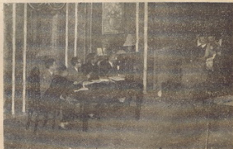
Uma cena da revista dos futuros «Economistas»

Promovida pela Associação dos Estudantes do Instituto Superior de Agronomia, realizou-se no «Auditorium» da Tapada da Ajuda uma «Serenata de Coimbra», que atraiu ali grande número de ouvintes. O esplêndido ambiente, a quietude, a moldura do arvoredo valorizada pela iluminação, tornam aquele «Auditorium» local privilegiado para manifestações artísticas ao ar livre. Com a «Serenata» de ontem, a evocar as das escadarias da Sé Velha, a beleza poética do recinto mais se acentuou; a plangência saudosista, o carácter idílico e romântico dos fados, das baladas e das guitarradas coimbrãs vincaram-se, sublimaram-se, no apaixonado tom das vozes e na perícia dos instrumentos.