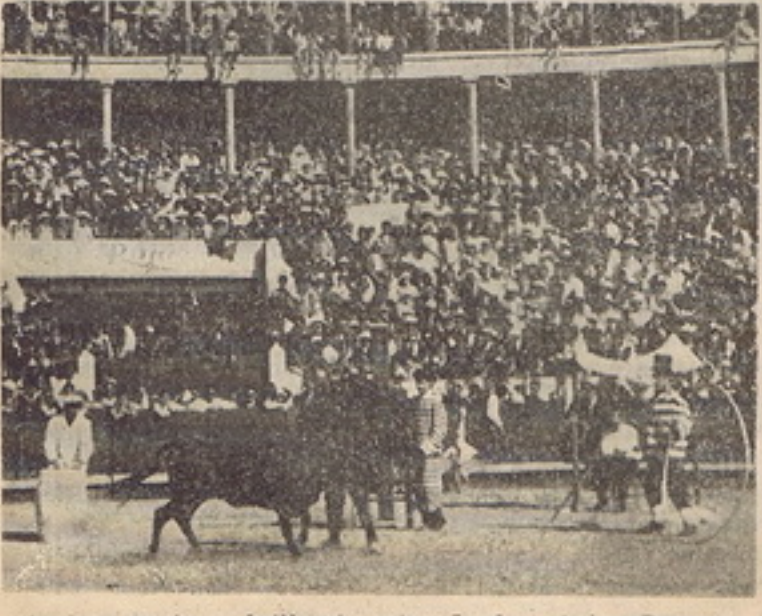
Aqui se mostra a brilhante actuação dos «Anima-Dores»