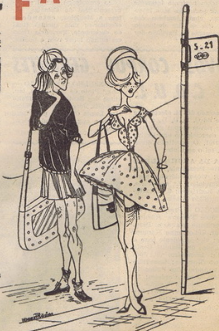
Depois das existencialistas, as flausinas!