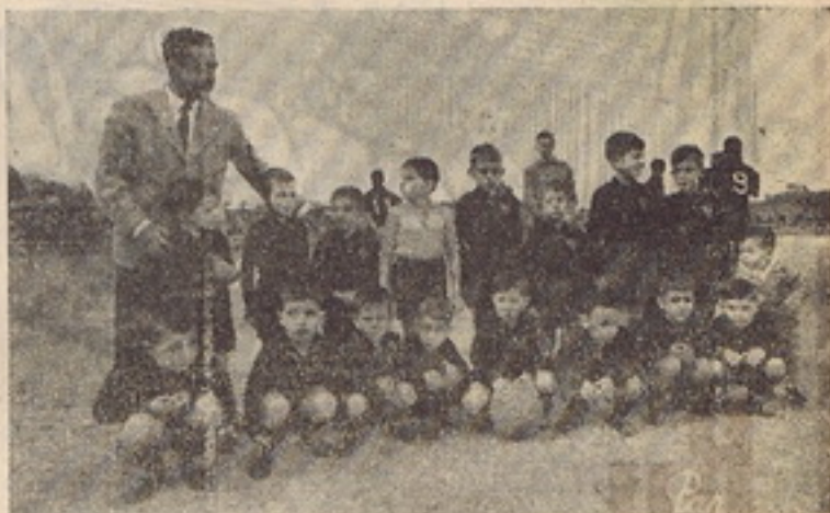
Quando da visita da A. A. aos Açores, apareceu no rectângulo, esta turma de infantiss, que despertou muita curiosidade

Com a Académica, isso não se deu. Fazendo alinhar sempre jogadores portugueses, ela con-