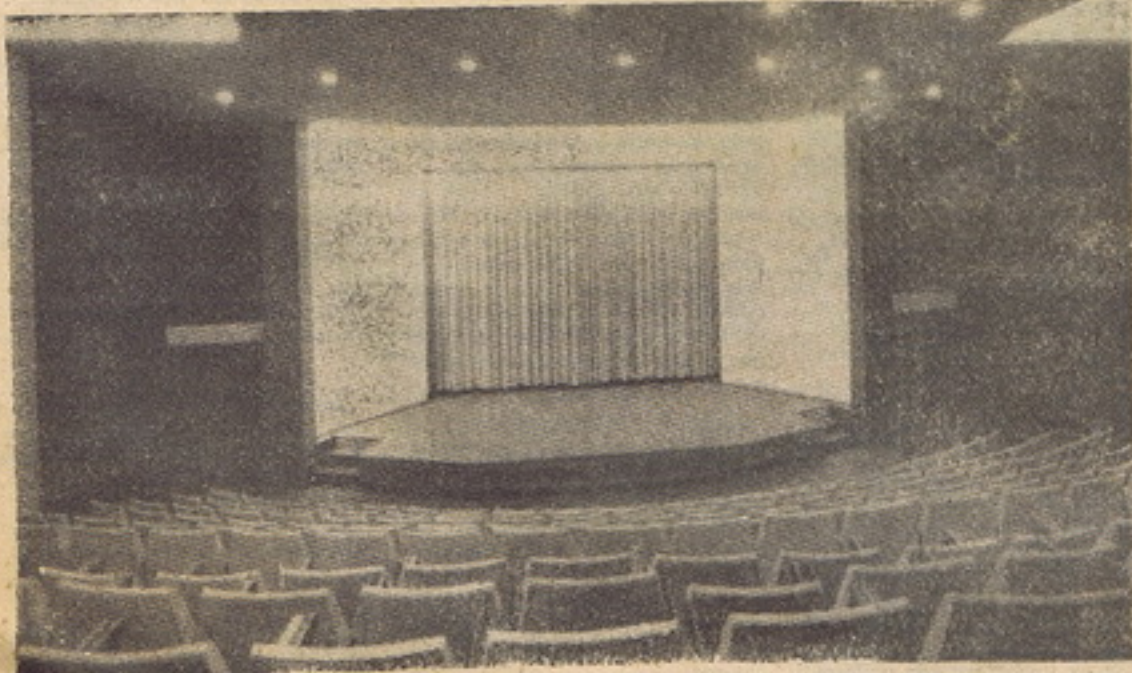
Um aspecto da Aula Magna há dias inaugurada