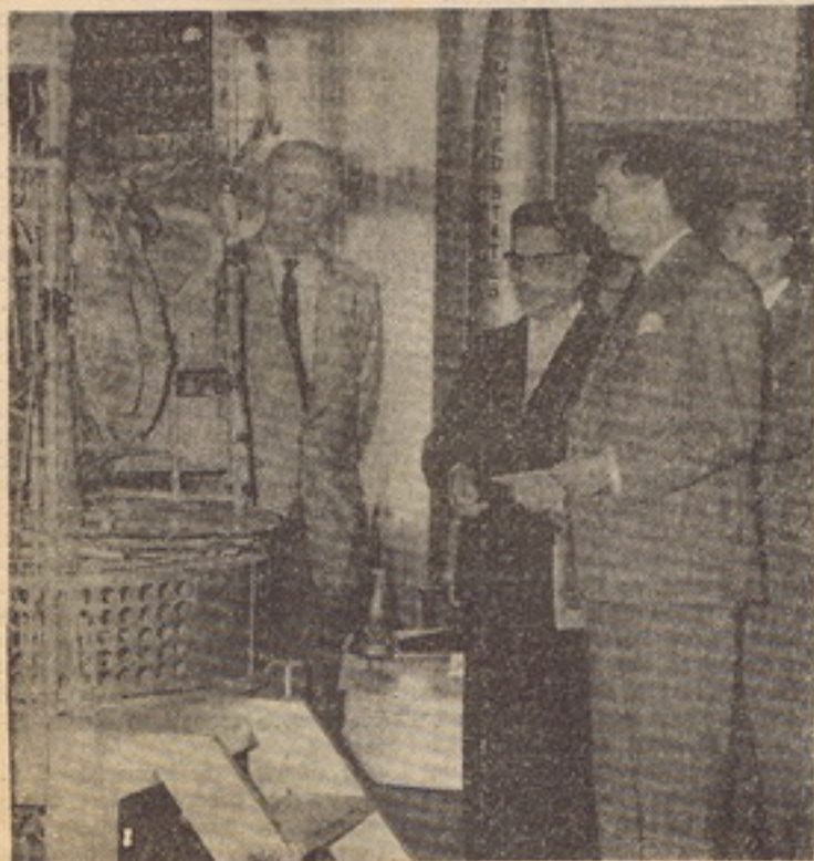
O sr. ministro Leite Pinto visita a exposição