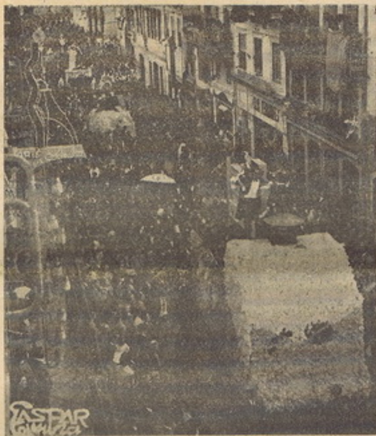
Um aspecto do cortejo