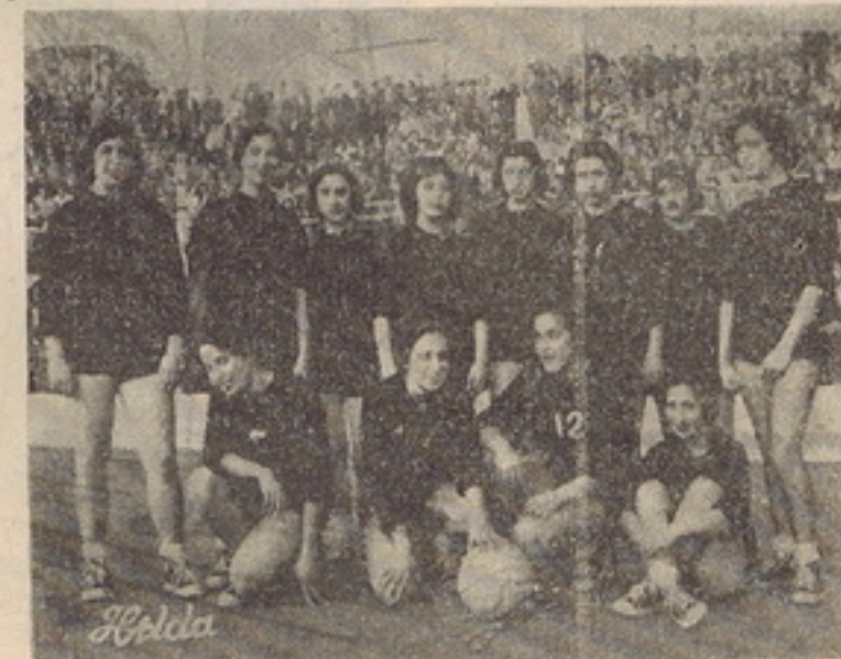
A simpática equipa de basquetebol da A. A. C. campeã nacional da época de 1959/60