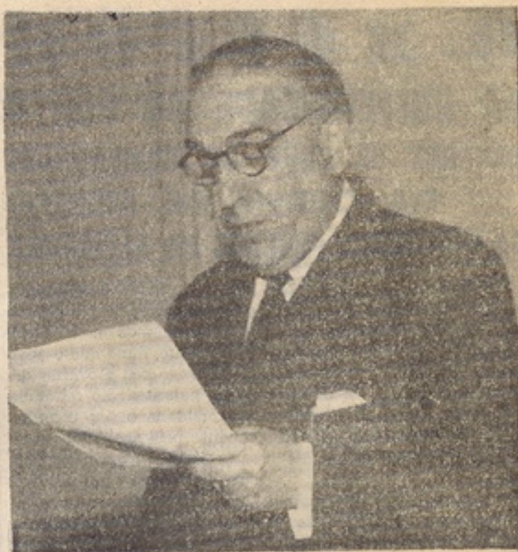
Gregorio Marañón doutor «Honoris Causa» pela Universidade de Coimbra